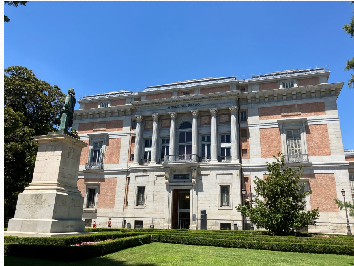
Muzeum El Prado – zadní část