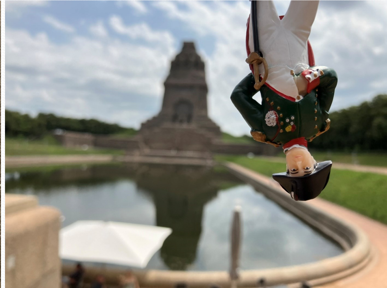
Památník bitvy u Lipska: 16. – 19. 10. 1813 Bitva u Lipska – největší bitva Napoleonských válek