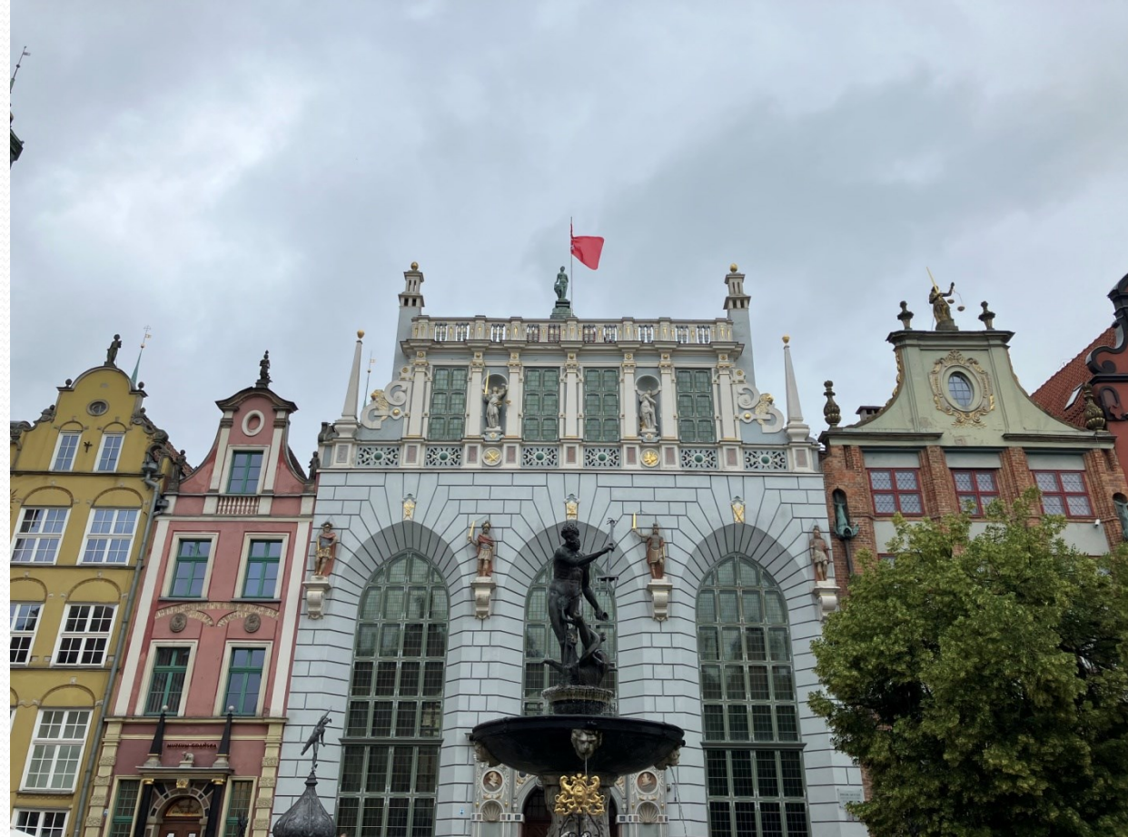
Artušův soud a Neptunova fontána