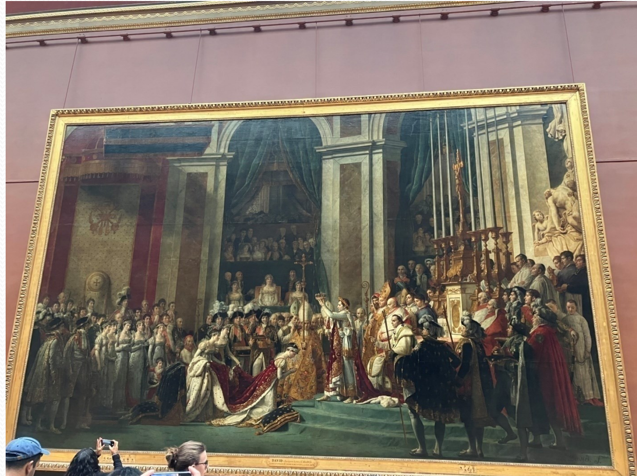
Louvre – Napoleonova korunovace