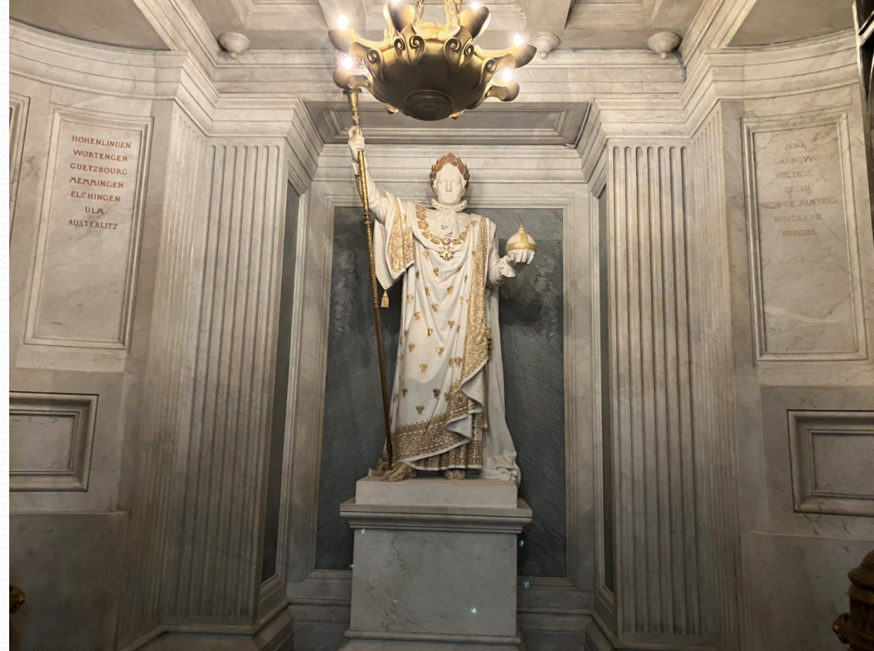
Invalidovna – místo s Napoleonovou hrobkou