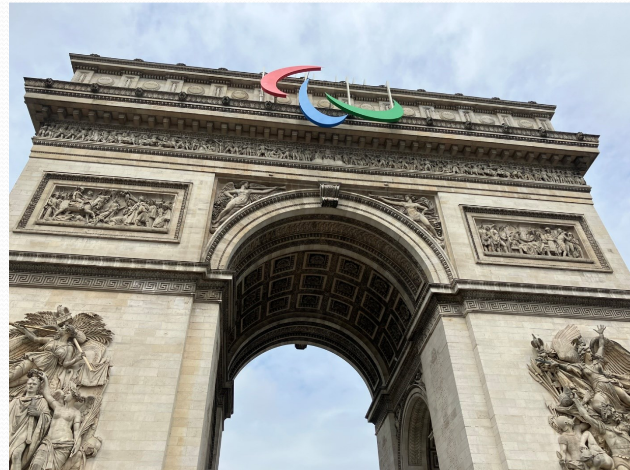
Vítězný Oblouk se symbolem letošní Olympiády