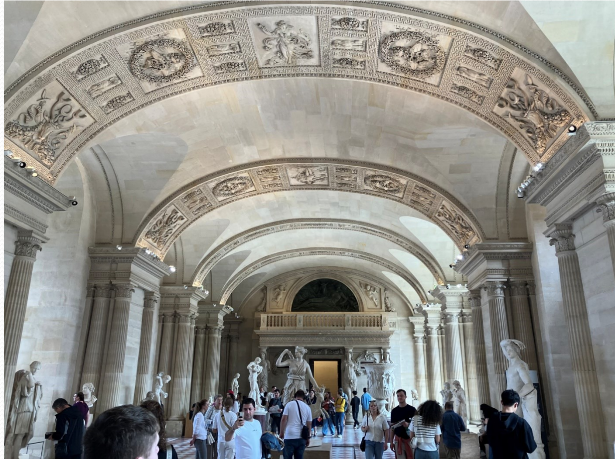
Louvre – Sochy řeckých bohů