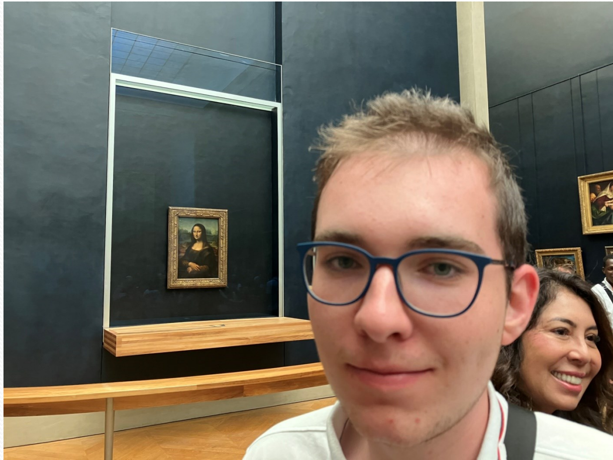
Louvre – Mona Lisa