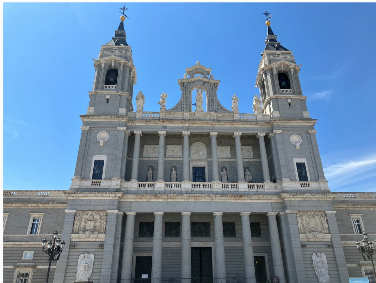
Katedrála Panny Marie Almudenské