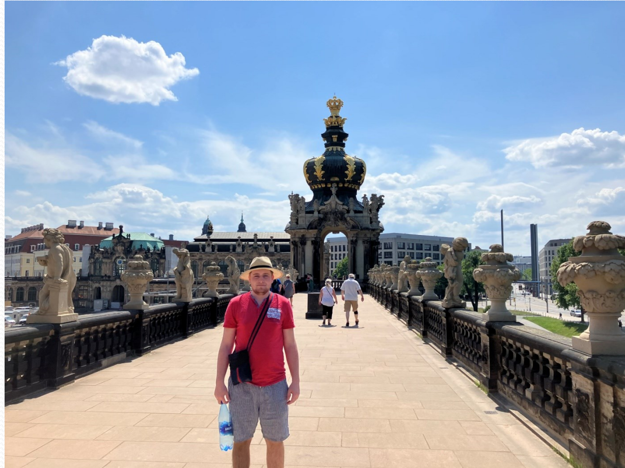
Zwinger - hradby