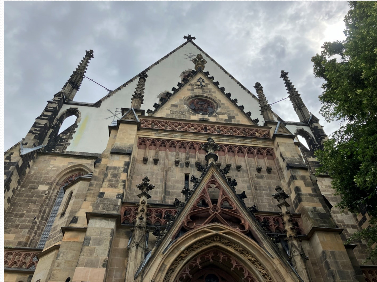
Kostel sv. Tomáše