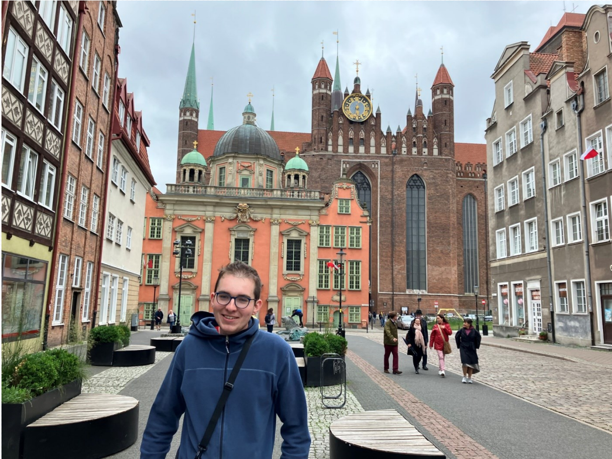
Katedrála v Gdaňsku