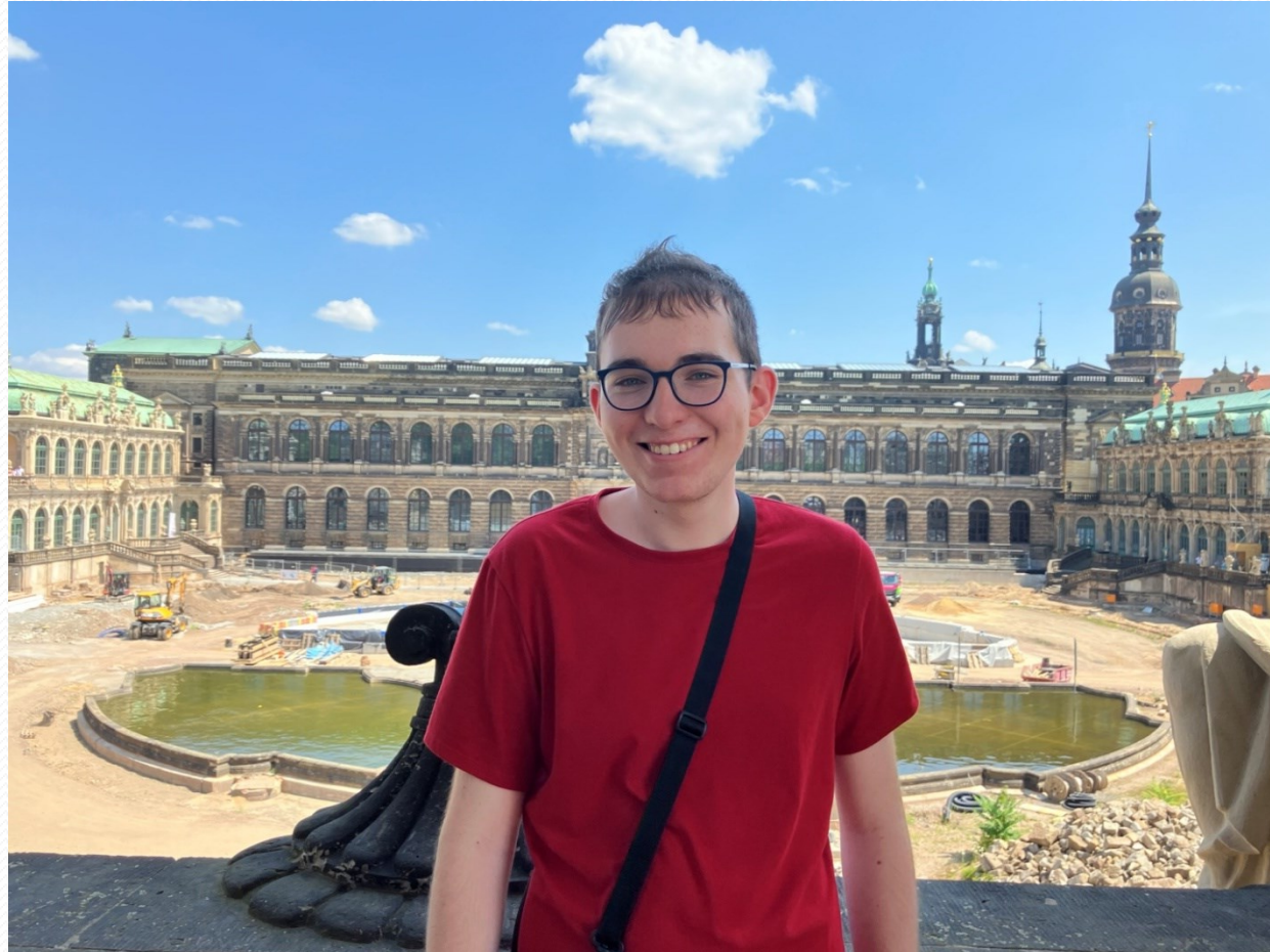
Zwinger – Galerie starých mistrů