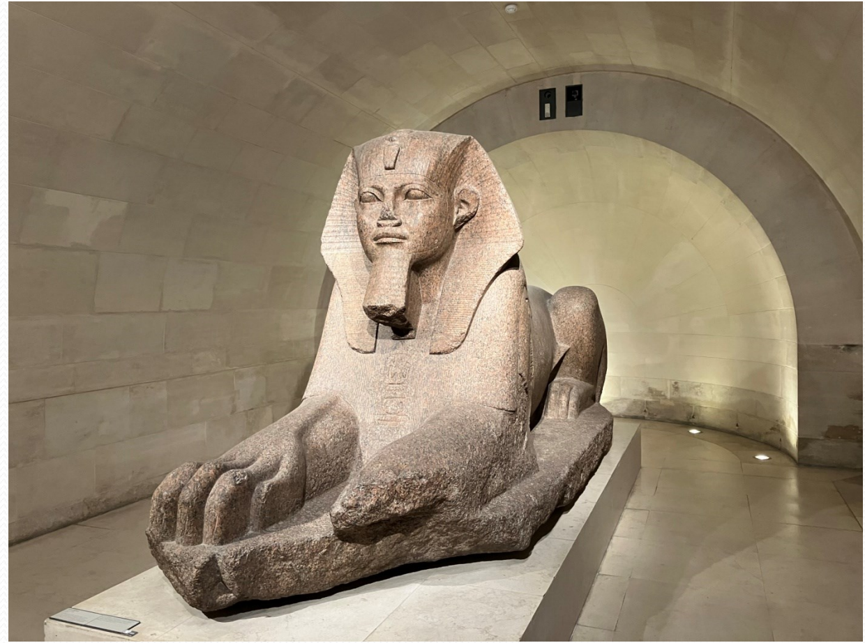
Louvre – Velká sfinga Tanis