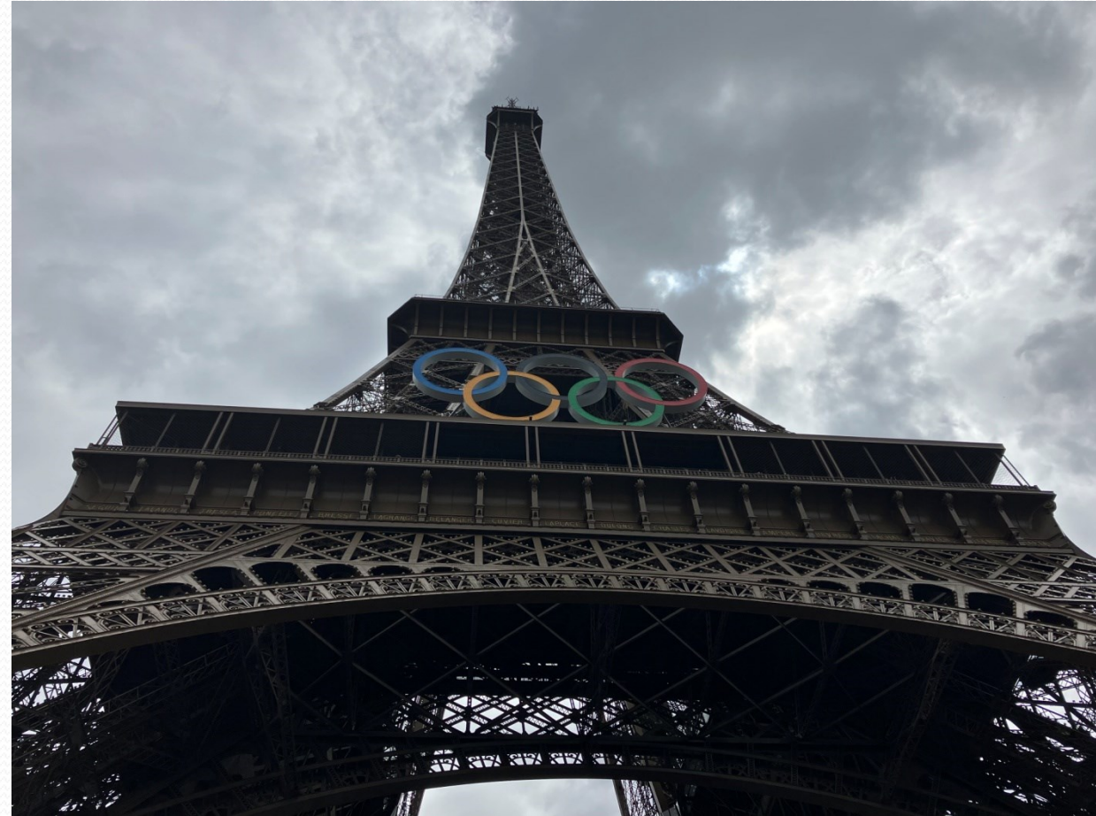
Eiffelova věž s Olympijskými kruhy