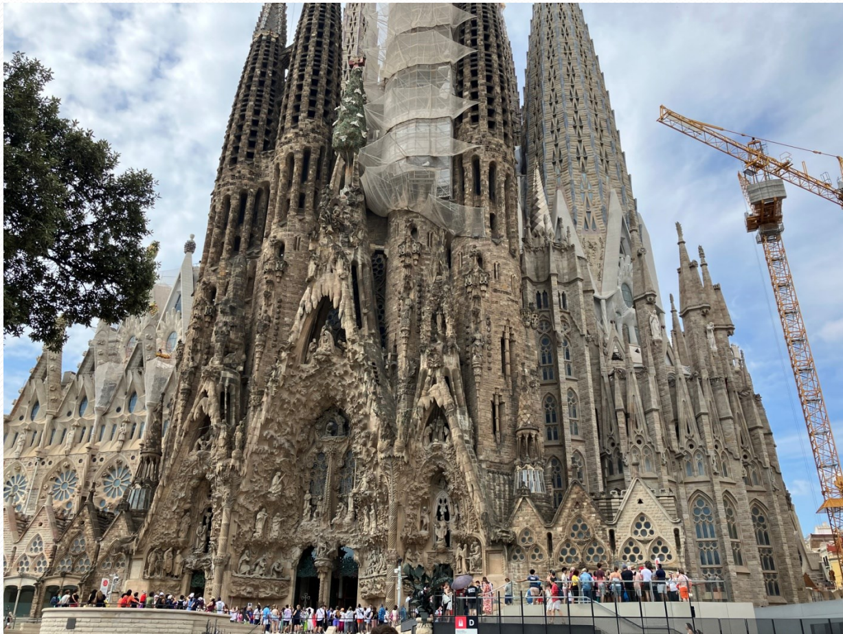
Sagrada Família – přední část