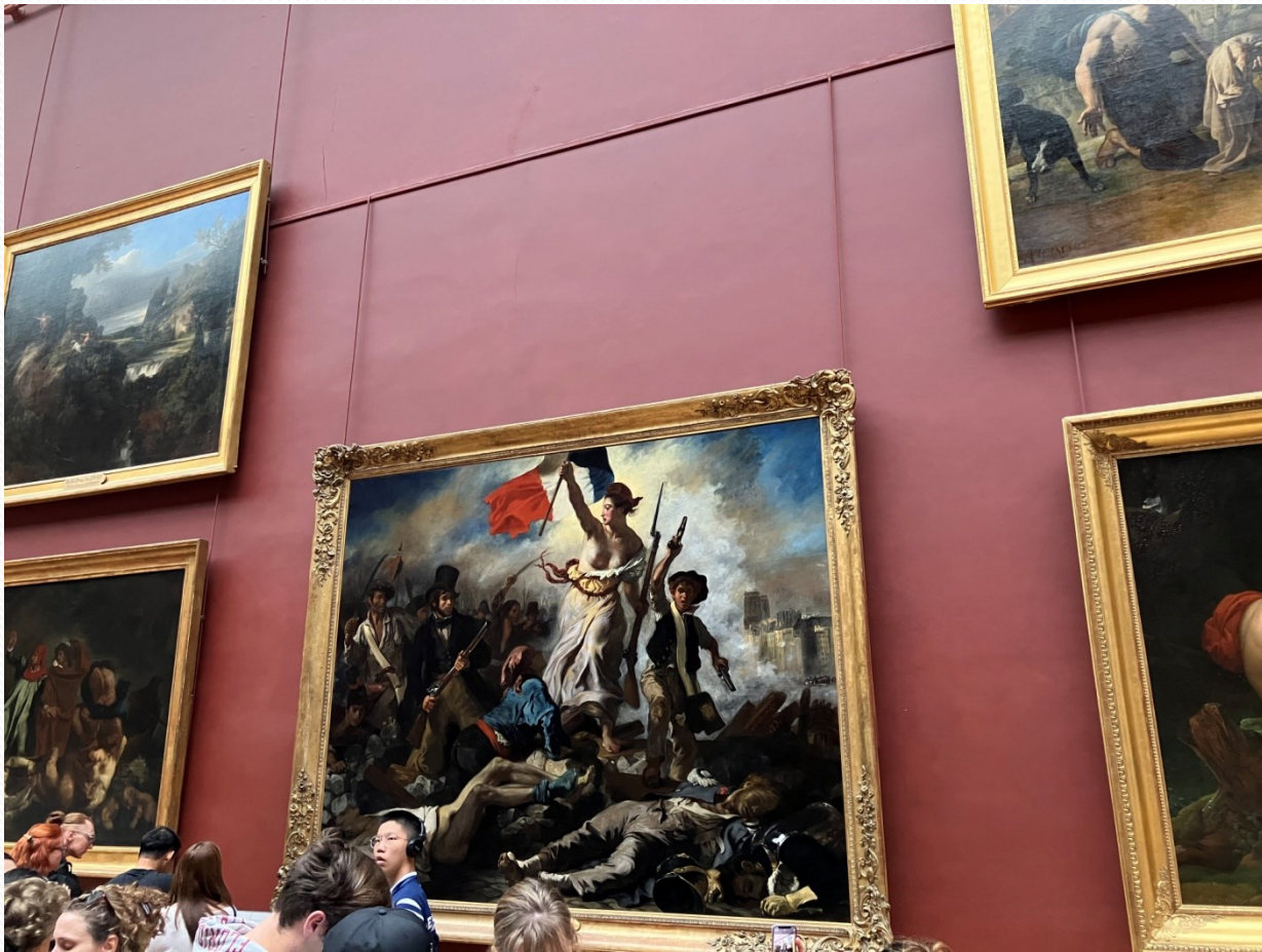
Louvre – Svoboda vede lid na barikády