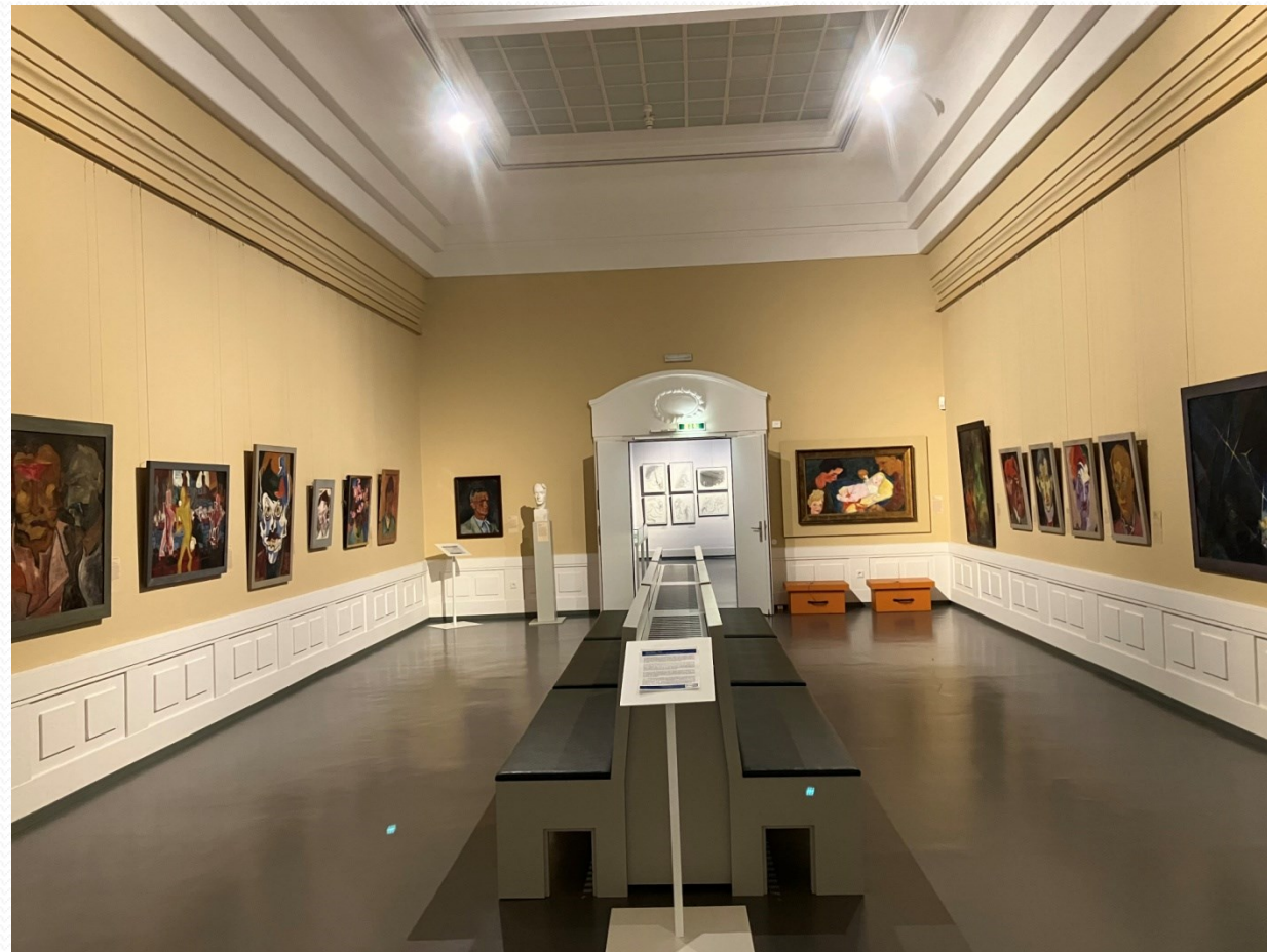
Budyšínské muzeum - galerie