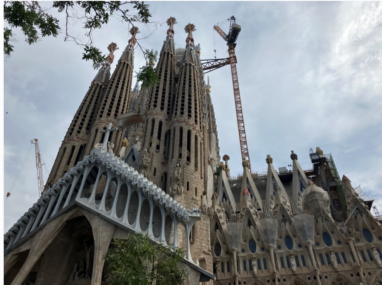
Sagrada Família – zadní část