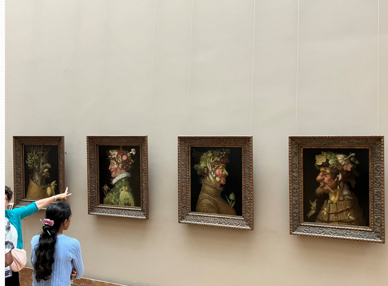
Louvre – Čtvero ročních období