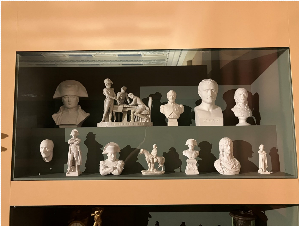
Budyšínské muzeum – busty a sošky s Napoleonem