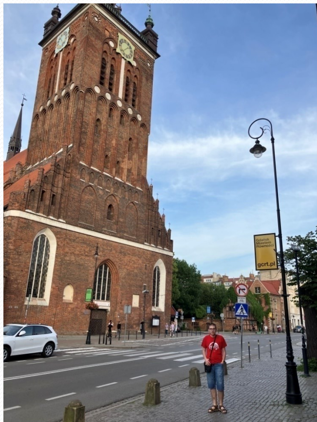
Kostel sv. Kateřiny